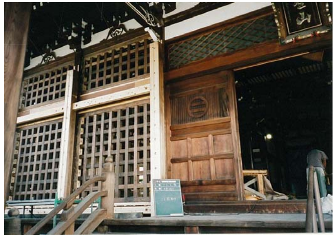
格子壁と新設添え柱