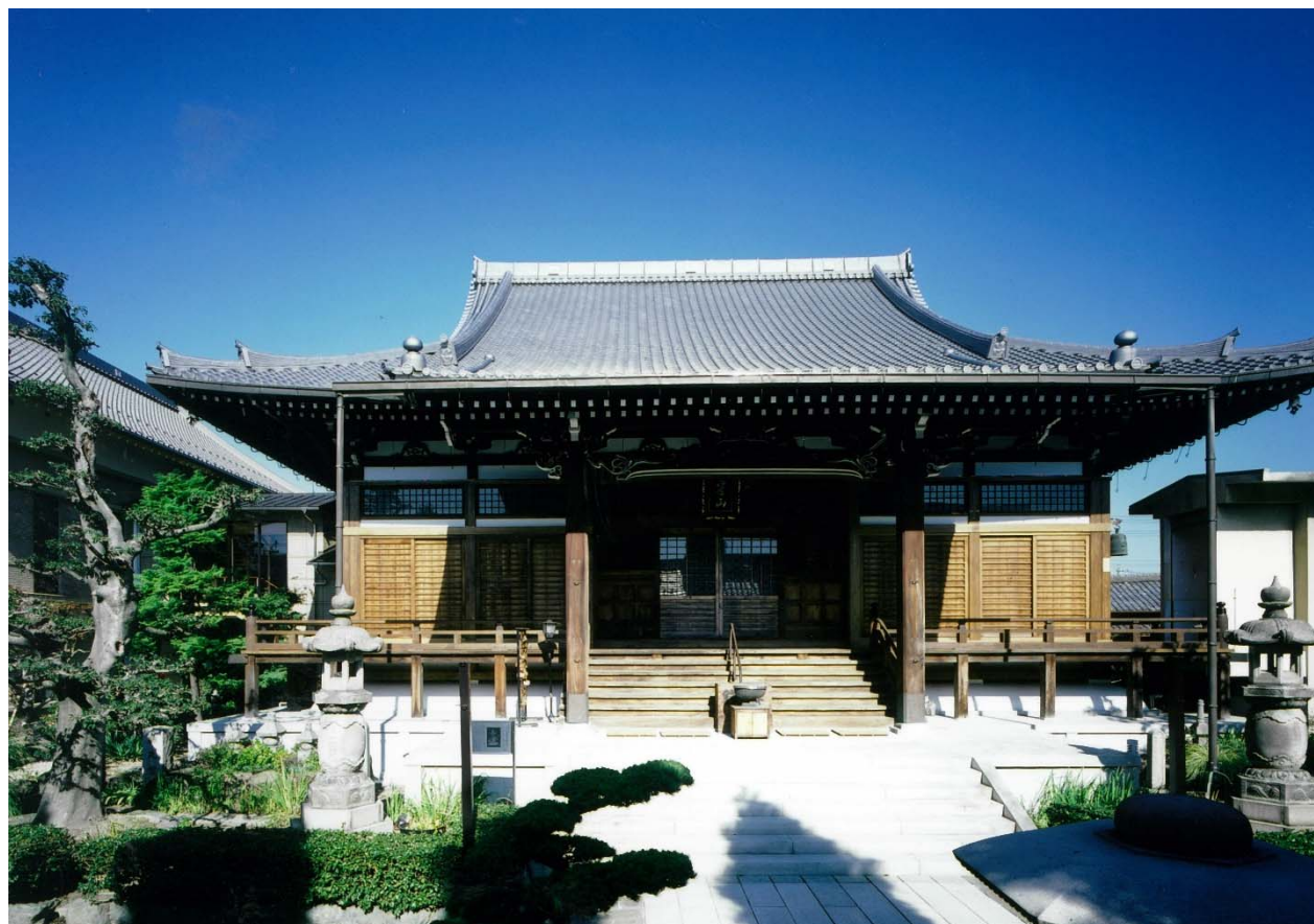
柳星山常念寺全景

柳星山常念寺は尾張一宮市にある西山浄土宗の寺院で、1390年に創建された。現在の本堂は、1955年に建てられたものであるが、伝統的構法による木造建築である。今回の耐震改修にあたっては、地盤、基礎、建物本体、歴史的経緯などについて入念な調査が行われており、それに基づいて改修方法を検討している。主要な耐震補強要素としては、格子壁を採用しているが、補強後の耐震診断では、この格子壁の水平剪断実験結果を用いている。格子壁を付けることによる柱の負担応力の増加に対しては、補強付柱によって対処している。また、鉄筋コンクリート造の基礎、床構面、小屋梁面、小屋組等についても、必要な補強を行っている。これらの補強がなされているにもかかわらず、意匠上はほとんど違和感がない。文化財になるにはまだ新しいこの種の寺院建築は、日本国中に無数に存在し、かつ、その多くは耐震補強の必要性があると思われる。この常念寺本堂の耐震改修は、個々の部分の補強方法としては格別目新しいものではないが、十分な検討により非常に手堅く改修されており、ほかの同種の寺院建築の耐震改修の参考例になるものであり、耐震改修優秀建築賞を受けるに値すると考え、ここに推薦する。